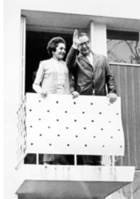
A la mañana siguiente del triunfo electoral.

En este juego de seducción, la esposa del ex presidente cumple un papel ingrato que mezcla resignación, cinismo, complicidad